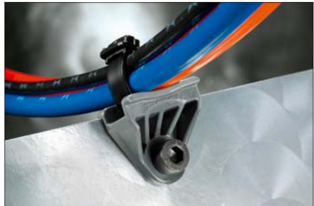
Die SA-Serie ermöglicht die Führung von Leitungen in einem definierten Abstand. So können mögliche Beschädigungen vermieden werden.