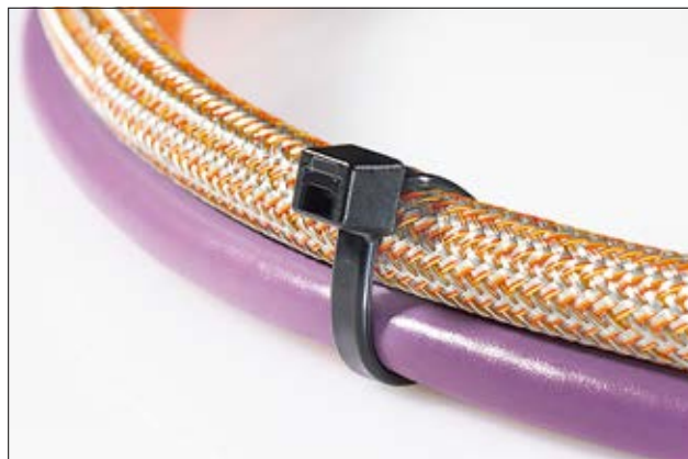
Colliers à tête carrée - Série LK (tailles intermédiaires aux colliers de la série T).