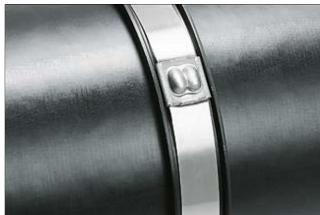
Collier de la série MBT avec profilé de protection LFPC.