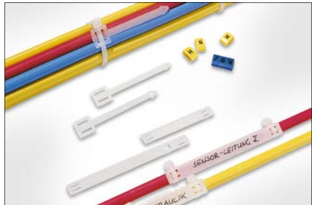
Une bonne lisibilité pour identifier les cables et les tuyaux.