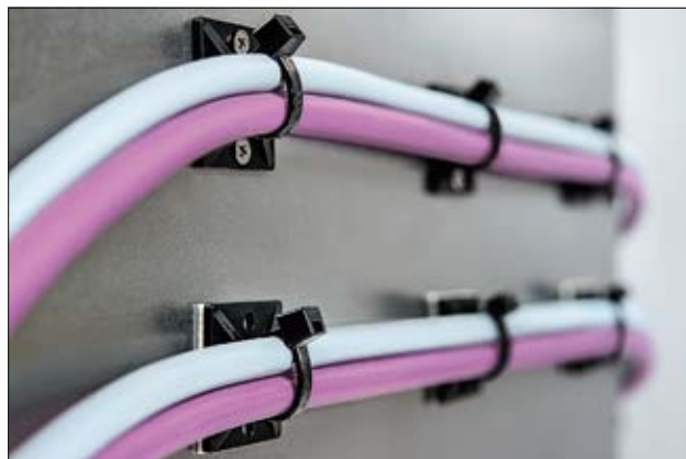
MB-serie zadels, vierkant, zelfklevend / schroefbaar.