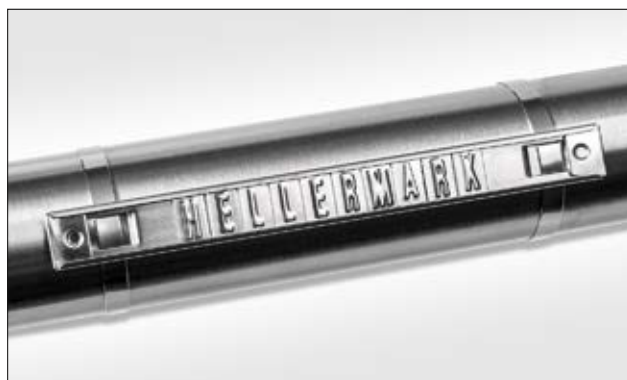
Hellermark SSC en SSM.

Technische wijzigingen voorbehouden. De minimale bestelhoeveelheid (MOQ) kan afwijken van de verpakkingseenheid. In sommige gevallen zijn andere verpakkingseenheden leverbaar. De minimale bestelhoeveelheid (MOQ) kan afwijken van de verpakkingseenheid. In sommige gevallen zijn andere verpakkingseenheden leverbaar.