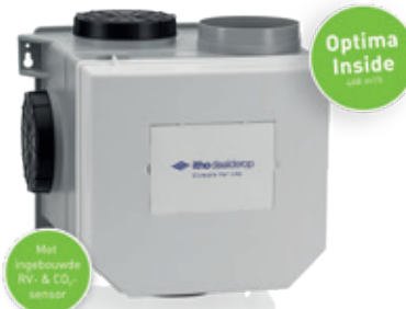
CVE-S ECO Optima Inside