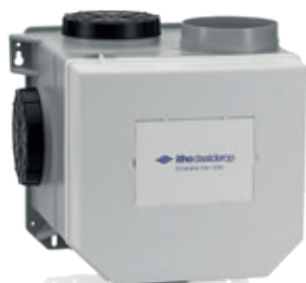
CVE-S ECO SE