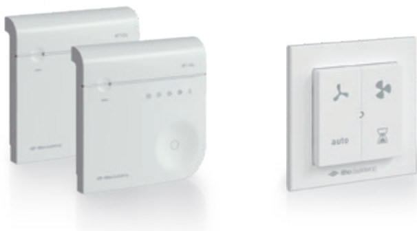
Optima 2 -set

meer mensen zich in de woonkamer bevinden, hoe meer CO 2 uitgedemd wordt en hoe meer er dus geventileerd wordt. De ventilatie-unit heeft een capaciteit van 468 m 3 /h. Bovendien bevat het pakket een extra snoer met Perilexstekker, zodat er voor elke woning een oplossing is.