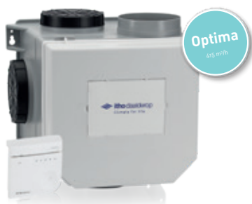
CVE-S ECO Optima