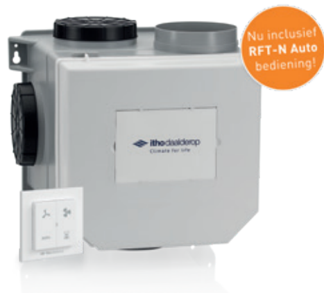
CVE-S inclusief RFT-N Auto