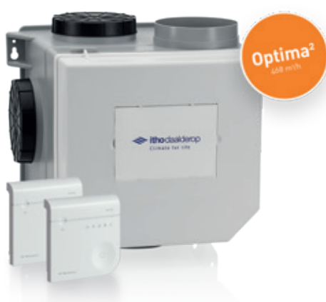
Optima 2 pakket