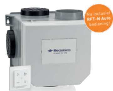
CVE inclusief RFT-N Auto