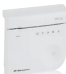
RFT CO 2 -sensor