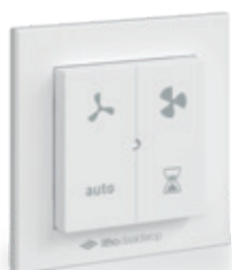
RFT-N Auto bediening

Naast de RFT-N Auto bediening kunnen er ook RFT-sensoren aan de ventilatie-unit worden gekoppeld, zoals bijvoorbeeld een CO 2 -sensor. Een CO 2 -sensor in de woonkamer zorgt ervoor dat