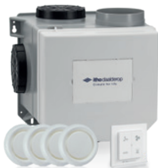
CVE-S ECO Alles-in-1 pakket