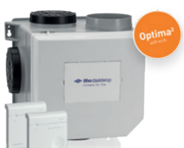
CVE-S ECO Optima²