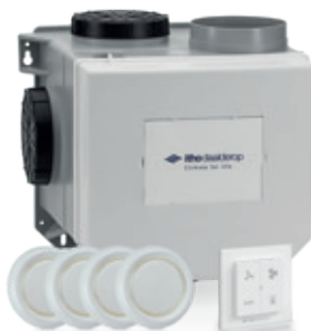
Alles-in-1 ventilatiepakket, CVE-S ECO en RFT Auto