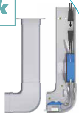
Sanicondens Clim pack