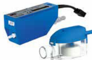
Sanicondens Clim mini (geleverd inclusief bevestigingssteun)